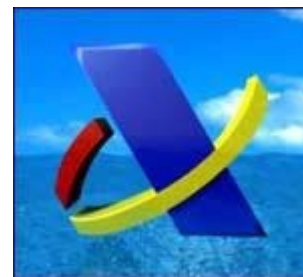
La presión fiscal en España ha aumentado casi el doble que en la UE-15 en 40 años

Reino Unido, República Checa, Malta, Luxemburgo, Polonia y Grecia han registrado cifras en torno al 40%, mientras que Letonia, Estonia e Irlanda alcanzaron un 38%, 36,9% y 36,7%, respectivamente. Eslovaquia, Rumania y Lituania fueron las únicas que han logrado quedarse por debajo del 35%