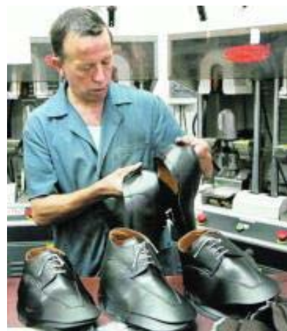
ABC Una empresa del sector calzado en Alicante